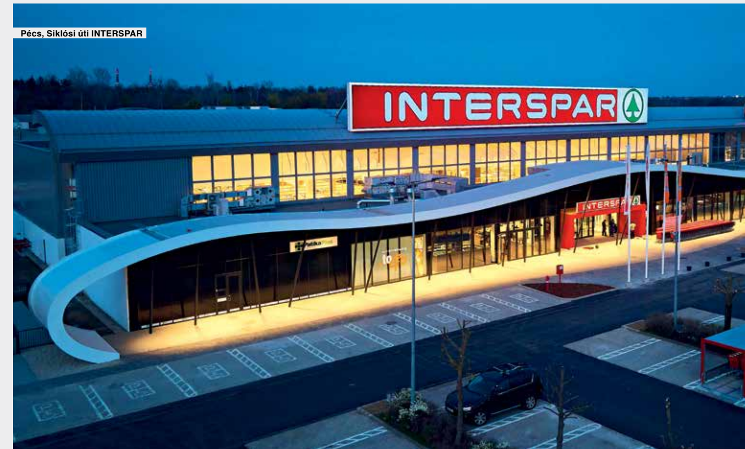
Pécs, Siklósi úti INTERSPAR

2022-ben 11 üzlet újult meg, valamint 2 újonnan nyílt áruházal bővült a SPAR-hálózat. Felújításra a vállalat bő 17 milliárd forintot költött, míg az új nyitások több mint 1,6 milliárd forint összértékű beruházásokból valósultak meg.