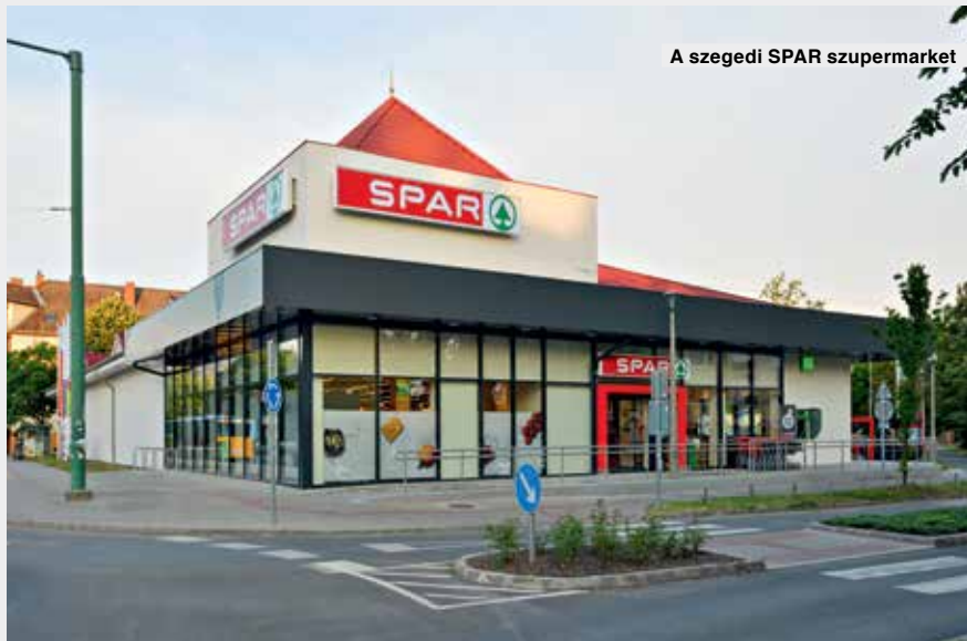
A szegedi SPAR szupermarket

A vállalat kiemelt figyelmet fordít az üzemeltetés során keletkező káros környezeti hatások minimalizálására.