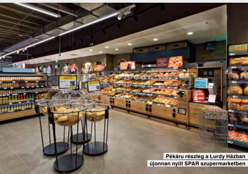
Pékáru részleg a Lurdy Házban újonnan nyílt SPAR szupermarketben