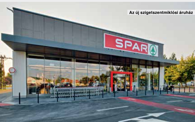
Az új szigetszentmiklói áruház

A Lurdy házban nyílt korszerű létesítmény hasonló belső felszereltséggel, mintegy 1800 négyzetméteren kapott helyet a kényelmes megközelítés érdekében a bevásárlóközpont földszintjén, a parkoló bejáratához közel.