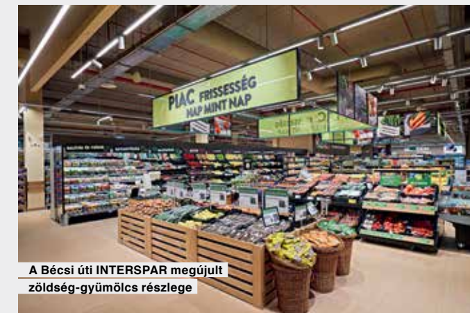
A Bécsi úti INTERSPAR megújult zöldség-gyümölcs részlege

A BÉCSI ÚTI INTERSPAR Észak-Buda és környéke első számú modern, igényes bevásárló- és élményközpontjaként működik, GOBUDA Mall néven. A több mint 2,3 milliárd forintos beruházás keretében komplex átépítésre került sor: az eladótér minden elemében megújult, és a korábbiakhoz képest jóval energiatakarékosabb is lett, köszönhetően a LED-világításnak és az ajtókkal felszerelt új hűtőbútoroknak, melyek CO 2 -alapú rendszerrel működnek. A hipermarketben kiemelt helyre kerültek az egészségtudatos táplálkozást segítő, valamint a bio- és diabetikus élelmiszerek, s elérhetővé vált az áruházlánc SPAR enjoy. convenience kényelmi termékeinek teljes választéka is. A gyorsabb haladás érdekében a vásárlók már önkiszolgáló kasszákat is választhatnak a vásárlás végzetével.