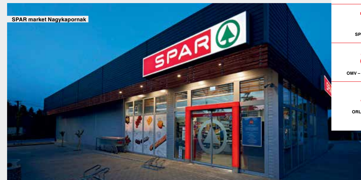
SPAR market Nagykapornak

A SPAR-családhoz tartozni számos előnnyel jár, amiben egyre több kereskedő látja meg a lehetőséget. Többek között a több mint 16 ezer termékből álló áru kínálat, melyet partnerei részére biztosít a vállalat, a számukra nyújtott logisztikai szolgáltatások, a fejlett informatikai háttér támogatás, az értékesítési és friss termékekkel foglalkozó tanácsadók szakmai segítsége, valamint az évente megszervezett zöldség-gyümölcs-, pék- és húsrú-oktatás. Ezenfelül a csatlakozó üzletek külső-belső átalakításán esnek át, melynek eredményeként megújul a homlokzat, az eladótér, és új géppark kerül az egységekbe. Mindehhez a SPAR számára fontos fenntarthatósági célkitűzések jegyében energiatakarékos berendezéseket, valamint modern hűtő-fűtő és világítástechnikát biztosítva.