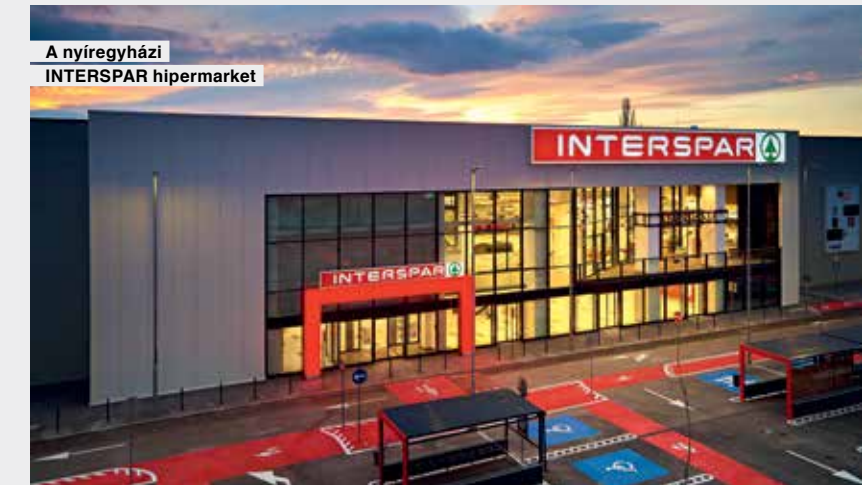
A nyíregyházi INTERSPAR hipermarket

A felújítási munkálatok végeredményeként a vásárlók a 21. század fogyasztói igényeit messzemenőig kielégítő üzletekben intézhetik napi bevásárlásaikat.