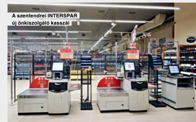
A szentendrei INTERSPAR új önkiszolgáló kasszái