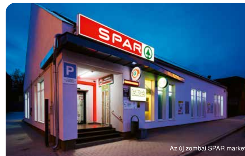
Az új zombai SPAR market

A vállalat franchise-hálózata huszonöt üzlettel bővült 2023-ban. A SPAR Partner program tízéves jubileumát követő évben több üzlettulajdonos is a SPAR Magyarországot találta a leginkább versenyképesnek és innovatívnak a franchise-rendszerben működő kiskereskedelmi hálózatok közül.