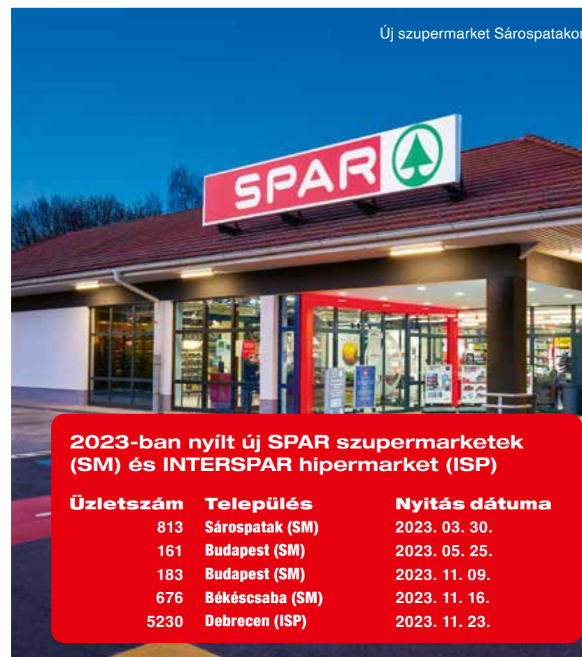
Új szupermarket Sárospatakon

Sárospatakon közel 750 millió forintból nyílt meg egy új, az energiatakarékosságot is szem előtt tartó, széles áruválasztékot kínáló, modern szupermarket. A 984 négyzetméter alapterületű áruház Sáros-