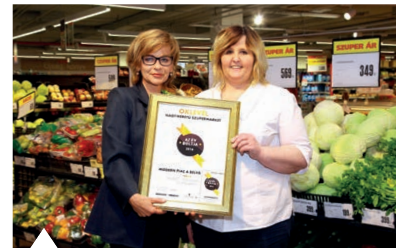
2016-BAN AZ ÉV BOLTJA DÍJÁT A BUDAPESTI MAMMUT BEVÁSÁRLÓKÖZPONTBAN LÉVŐ 174 SM NYERTE EL