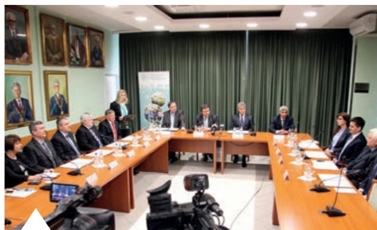
EGYEZTETÉS A DUÁLIS KÉPZÉS RÉSZLETEIRŐL

GYAKORNOKI PROGRAMOK TRAINEE PROGRAMOK • FŐISKOLÁS GYAKORNOKOK • NEMZETKÖZI GYAKORLATON RÉSZT VEVŐK DOLGOZÓI KARRIERPROGRAMOK TOPELADÓKÉPZÉS • SPAR-MESTER-KÉPZÉS KÉPZÉSEK VEZETŐKNEK VEZETŐI KÉSZSÉGFEJLESZTÉS • COACHING