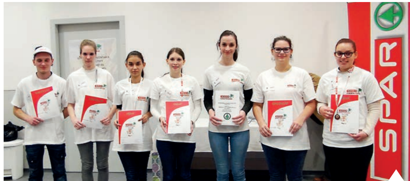
SPAR KIVÁLÓ TANULÓJA 2016: A DÖNTŐS CSAPAT

A kiskereskedelemben egyedülálló módon, a potenciális munkavállalók közvetlen és hatékony elérése érdekében a SPAR decemberben megnyitotta első Karrier irodáját Budapesten, a Nyugati