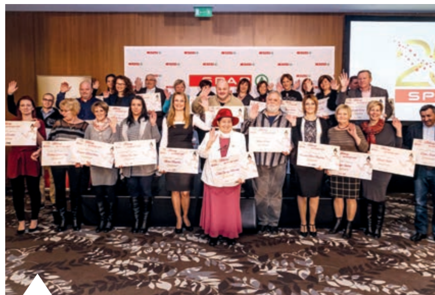
A „MILLIÓNYI NYEREMÉNNYEL VÁRJUK!” PROMÓCIÓ NYERTESEI

Márciusban a vásárlóknak lehetőségük nyílt rendkívüli kedvezménnyel SPAR ajándékkártyákat vásárolni, az ezt követő szülinapi promóciók során pedig ingyen terméket, illetve sorsjegyet kaptak a pénztárukánál. Egy másik akcióban a szülők foghattak össze és közösen gyűjthették a blokkokat, hogy ők nyerjék a kisorsolt osztálykirándulások egyikét. A Szülinaptündérrel – vagyis Ördög Nórával, aki egész évben a kampány arca volt – is alkalmat kínáltunk egy közös kép elkészítésére üzleteinkben, de nagy sikert aratott Horváth Ilona legendás szakácskönyvének jubileumi kiadása is. A másfélszeres SuperShop pontbeváltás lehetőségével is sokan éltek, erre az év során két alkalommal is lehetőség nyílt. A két legnagyobb nyereményjáték októberben és novemberben valósult meg: a „Milliónyi nyereménnyel várjuk!” aktivitás keretében 25 x 1 millió Ft mellett egy Nissan Pulsar személygépkocsi is gazdára talált, míg a „25 álomnyeremény” promócióban a vásárlók választhatták ki, mit szeretnének megnyerni a 25 különböző, egyaránt nagy értékű és ütős nyeremény közül.