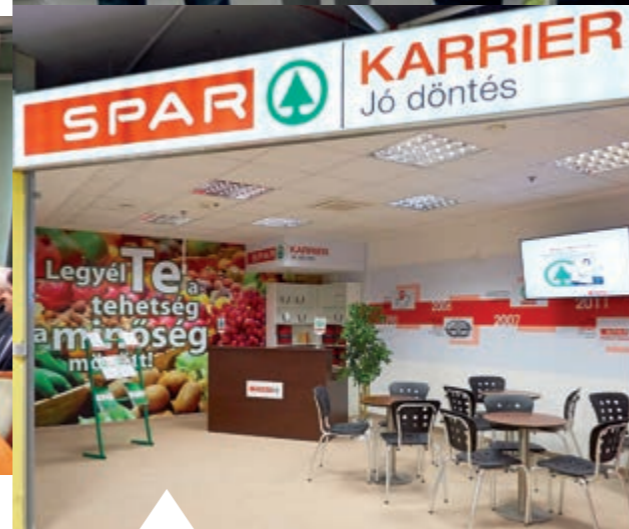
A BELVÁROSI TOBORZÓIRODA