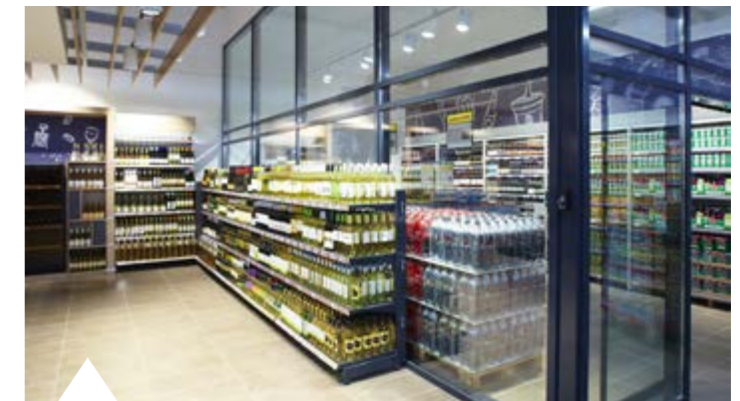
A MEGÚJULT KEREPESI ÚTI SPAR BELSŐ TEREI

Az év egyik legnagyobb beruházásaként – több mint 750 millió forint értékű átalakítás eredményeként – igazán impozáns, modern áruház fogadja novemberből a vásárlókat Budaepsten, a Kerepesi úton. A boltbelső a SPAR új áruházmodellje szerint alakították ki: egyedülálló módon