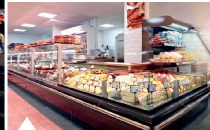
A 100. FRANCHISE ÜZLET BUDAPESTEN, AZ UNGVÁR UTCÁBAN NYÍLT MEG SZEPTEMBERBEN

A SPAR folyamatosan és kiemelten támogatja a franchise partnereket helyi és országos reklámkampányok segítségével.