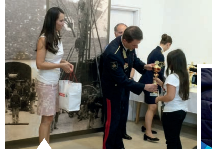
A SPAR TÁMOGATÁSÁT ÉLVEZŐ ORSZÁGOS TŰZMEGELŐZÉSI RAJZPÁLYÁZATRA KÖZEL TÍZEZER PÁLYAMŰ ÉRKEZETT

A 2015-ben kialakított támogatási folyamat – melynek alapja a www.sparsegitokezek.hu , amely 2013 óta fontos eleme a társaság CSR politikájának – átláthatóságot biztosít a vállalatnak, a támogatottak pedig egyenlő eséllyel pályázhatnak. Ennek köszönhetően a SPAR számos területen tud segítséget nyújtani: