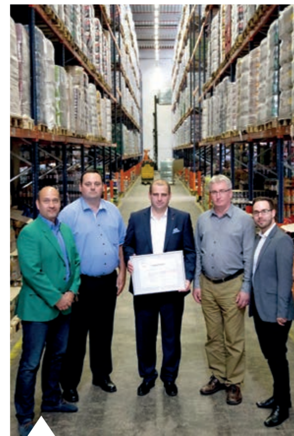
A VÁLLALAT LOGISZTIKAI TERÜLETE 2016-BAN IS BETARTOTTA A NEMZETKÖZI ÉLELMISZERIPARI SZABVÁNYT

A vállalat az emberi fogyasztásra alkalmatlan élelmiszereket állatvédő szervezeteknek, állatmenhelyeknek, állatkerteknek adományozza.