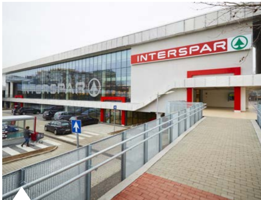
A PESTERZSÉBETI INTERSPAR A TELJES KÜLSŐ-BELSŐ ÁTALAKÍTÁS UTÁN

Márciusban nyílt meg Tököl első SPAR szupermarketete. Az áruházat egy korábbi üzlethelyiségből alakították át több mint 135 millió forint ráfordítással. Az új szupermarket 980 négyzetméteres eladóterével a hálózat korszerű tagja, magas szinten nyújtva a SPAR-ra jellemző vásárlói előnyöket. A frissárú és a népszerű márkatermékek mellett a vevők megtalálják a kiváló minőségű, kedvező árú SPAR saját márkás termékeket, csakúgy, mint a különleges fogyasztói igényeket kielégítő árucikkeket, valamint a helyben sült pékárukat.