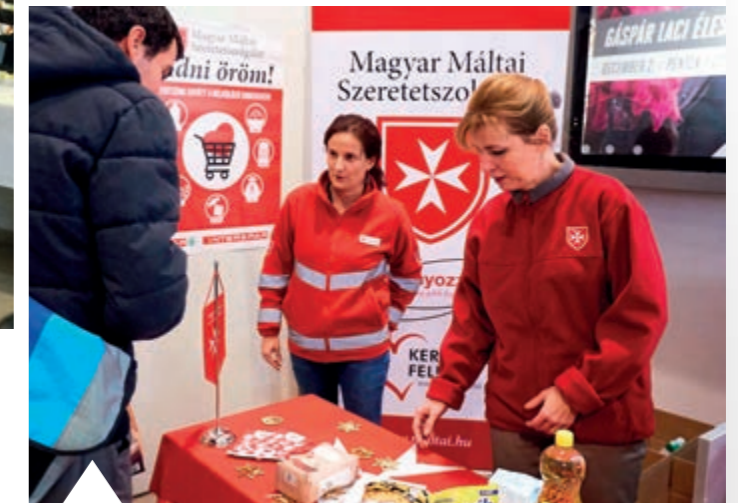
A HAGYOMÁNYOS ÉV VÉGI ADNI ÖRÖM! AKCIÓBAN HERCZEGH ANITA, ÁDER JÁNOS KÖZTÁRSASÁGI ELNÖK FELESÉGE IS SZEREPET VÁLLALT

A SPAR Magyarország megbecsülése jeleként évek óta támogatja a katasztrófavédelemben részt vevő kollégák munkáját. A vállalat és az